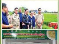
เจ้าหน้าที่ อบต. อบรมเกษตรกร