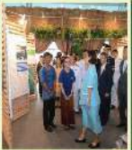
ดำเนินกิจกรรมรณรงค์การปลูกผักไหม (สวนชุมชน)