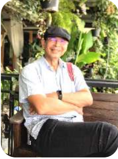
คำเพียง ร่องล้ามูล