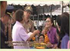
พิธีมอบรางวัล ผักไหมคุณภาพดี (รางวัลเกษตรกร)