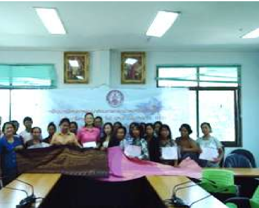
กลุ่มทอผ้าบ้านหาด (ของดีในชุมชนที่ไม่ควรมองข้าม)