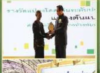
พิธีมอบรางวัล ผักไหมคุณภาพดี (รางวัลเกษตรกร)