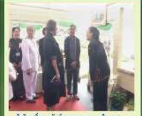
ดำเนินกิจกรรมรณรงค์การปลูกผักไหม (สวนชุมชน)