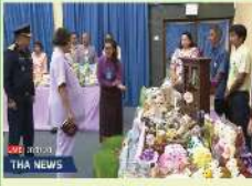
เจ้าหน้าที่ อบต. อบรมเกษตรกร (สวนชุมชน)