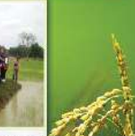
ดำเนินกิจกรรมรณรงค์การปลูกผักไหม (สวนชุมชน)