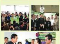
ดำเนินกิจกรรมรณรงค์การปลูกผักไหม (สวนชุมชน)