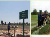
เจ้าหน้าที่ อบต. อบรมเกษตรกร