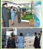
เจ้าหน้าที่จากหน่วยงาน อบต. อบรมเกษตรกร